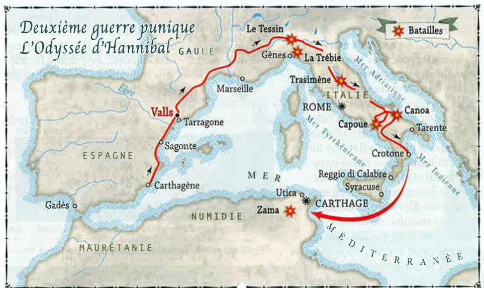
Parti de Carthagène avec 102 000 hommes et 37 éléphants, selon l'historien latin Tite-Live, Hannibal gagne l'Italie en traversant les Pyrénées puis les Alpes. 15 ans plus tard, il rentre en Afrique et est vaincu à Zama.